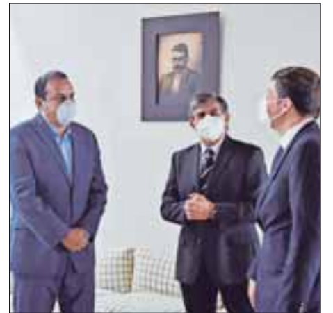
Morelos ofrece grandes bondades para la atracción de la inversión, como lo es la conectividad, el clima y el excelente capital de trabajo

Así, los municipios extraerán de sus corazones, de la riqueza de su tierra, de su historia y su amor, la mexicanidad como fuente inagotable de creatividad.