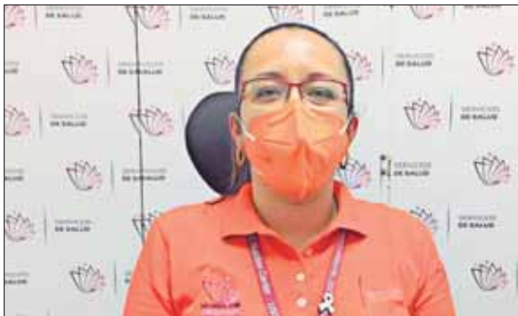
Los nuevos pacientes son 52 mujeres de Amacuzac, Cuautla, Cuernavaca, Emiliano Zapata, Huitzilac, Jiutepec, Jojutla, Ocuituco, Puente de Ixtla, Temixco, Tepalcingo, Tlaltizapán, Tlaquiltenango, Totolapan, Xochitepec, Xoxocotla, Yautepec y Zacatepec: Cecilia Guzmán

■ Indispensable no bajar la guardia; respetar la sana distancia y reducir movilidad