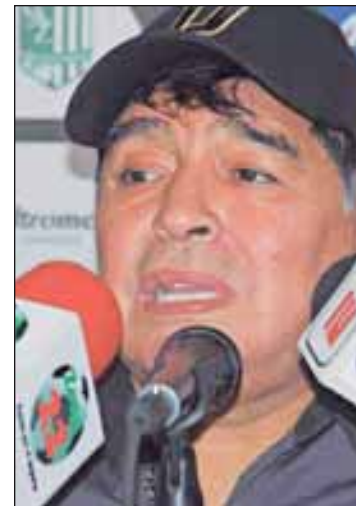
Vale recordar que Diego Armando pisó el campo del “Coruco” Díaz en su paso por el fútbol mexicano