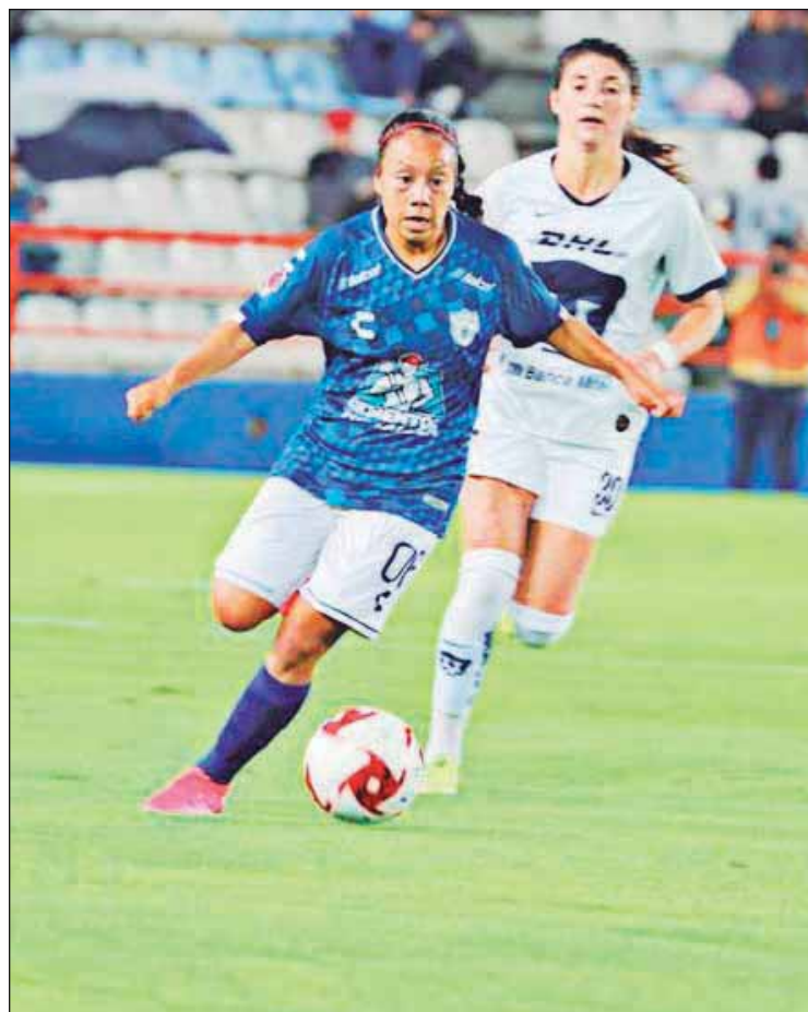
Tigres y Pachuca será un encuentro entre jugadoras morelenses. ■ Foto: Cortesía

■ Quedó definida la ronda de finales del circuito rosa