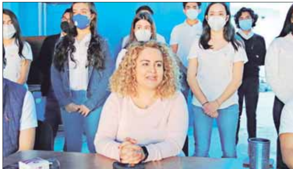
Durante el periodo de aislamientos donde se han registrado más casos de agresión es en las colonias Patios de la Estación, Altavista, Sacatierra, Antonio Barona, Cerritos, Centro y La Carolina