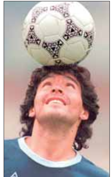
El futbolista Diego Armando Maradona, murió este miércoles en Buenos Aires de un paro cardiorrespiratorio. Ante la muerte del ídolo del balompié, se decretaron tres días de duelo nacional, en aquel país.