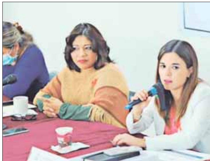
Encuentro sostenido entre los integrantes de la Comisión de Hacienda, Presupuesto y Cuenta Pública del poder Legislativo con la secretaria de Hacienda, Mónica Boggio ■ Fotos: Cortesía