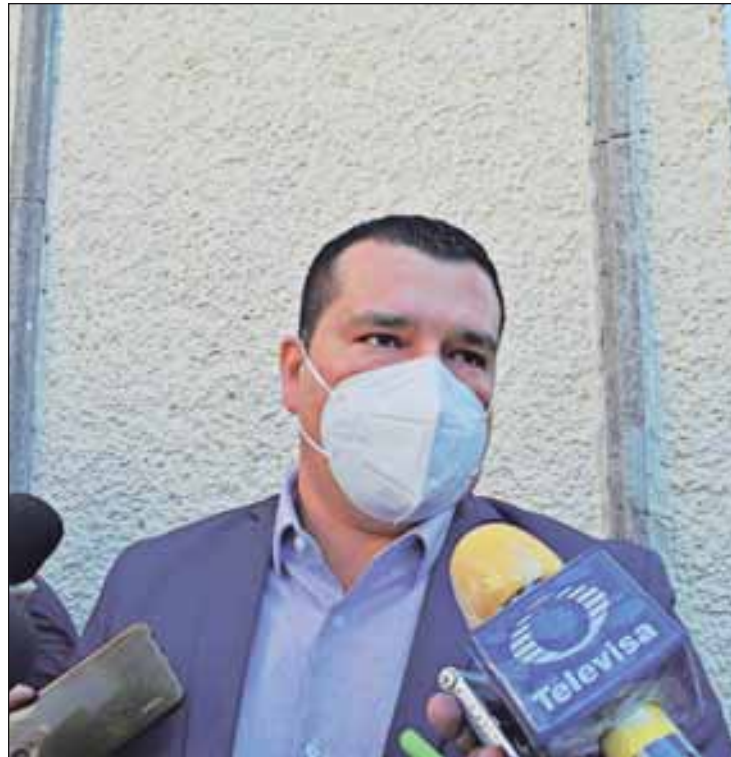
No politizar el tema Zapotitla Becerro, pide abogado de la víctima

■ Que los diputados actúen conforme a la ley y no protejan a nadie: Gibran Haro