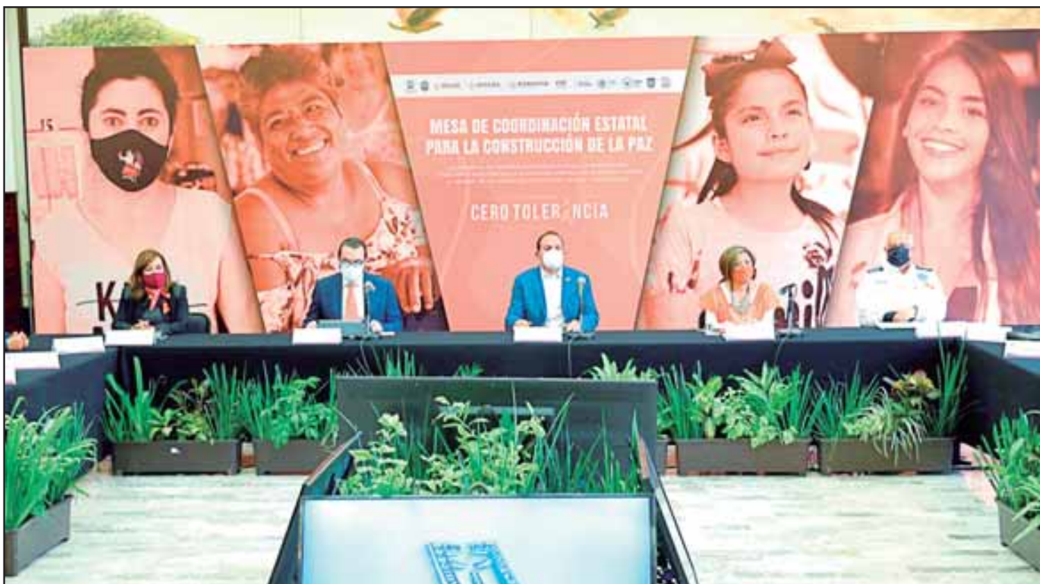
En el acto donde se anunció que Morelos se adhiere a la Agenda para la Prevención, Atención y Sanción de la Violencia Contra Mujeres y Niñas, de la Estrategia Nacional de Paz y Seguridad, el gobernador del Estado, Cuauhtémoc Blanco destacó: "esta lucha no es sólo de las mujeres, es de todas y todos"

Dos de cada tres mujeres enfrentan violencia; visibilizan hechos