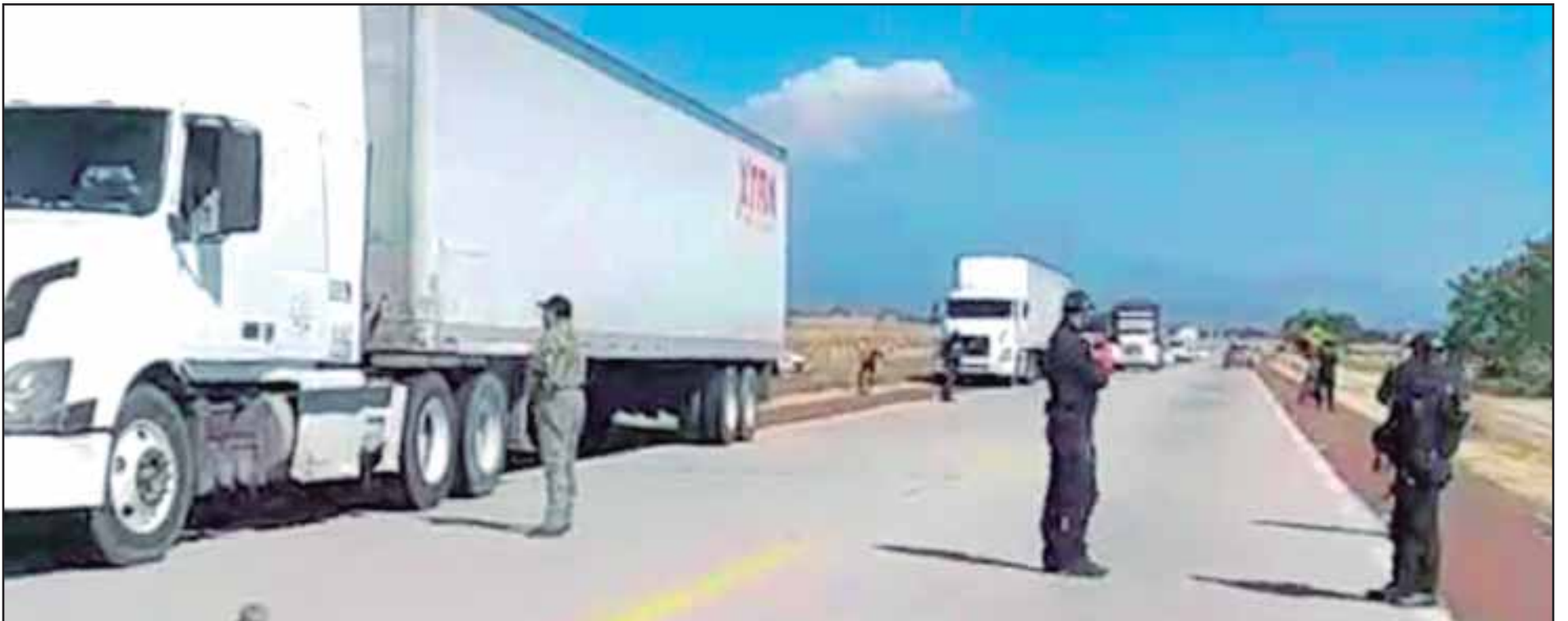
Las protestas contra el proyecto en Huexca, no cesan en la región oriente

Desolador panorama de fin de año para comerciantes en pequeño