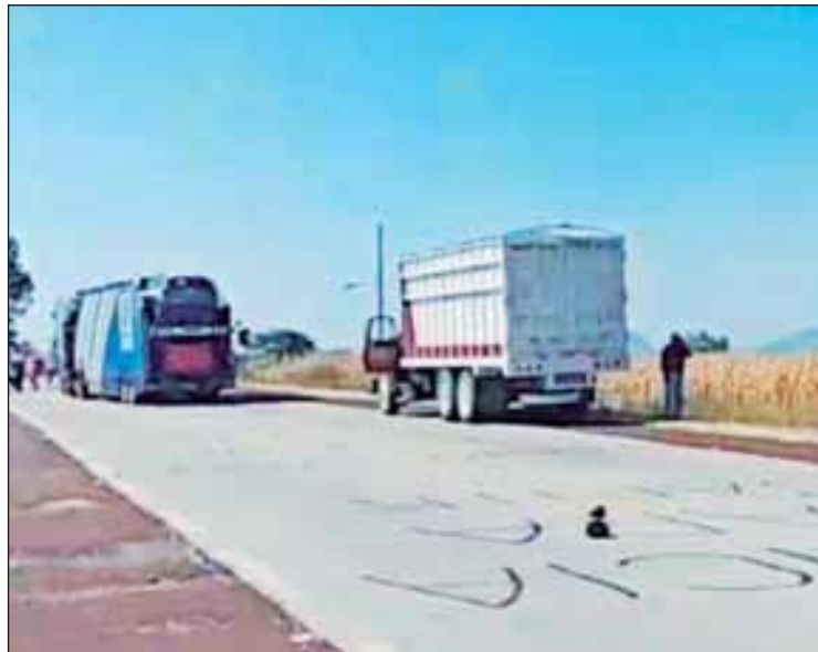
Los pobladores exigen el retiro de la Termoeléctrica que forma parte del Proyecto Integral Morelos (PIM)

■ Ante bloqueos, se fortalecen los operativos tras el desalojo en Apatlaco