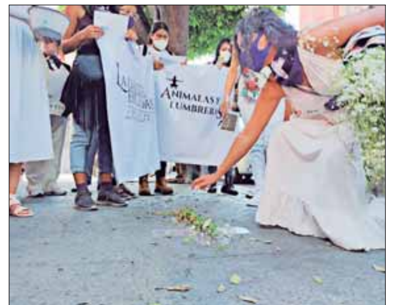
Dibujan 40 cruces en su recorrido sobre avenida Morelos de la Catedral al Calvario representado a las difuntas

Este proyecto se denomina la danza de las excluidas y tendrán varios eventos en el presente mes, y cuenta con el apoyo de la convocatoria “Correr con Lobas”, de la secretaria de cultura del gobierno del estado